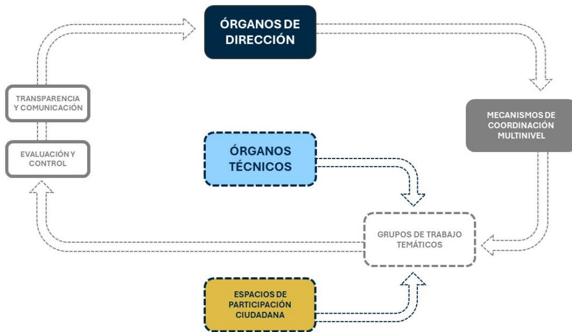
Tabla 2. Esquema de la gobernanza de la ADUR SACAM.

Pero, sobre todo, se necesita implicar activamente a la ciudadanía rural , a las empresas locales, a los agentes sociales y al tejido asociativo comarcal, no solo como beneficiarios de las políticas, sino como cogestores en igualdad de condiciones. La gobernanza debe garantizar mecanismos de participación real, transparencia, corresponsabilidad y confianza mutua entre todos los actores implicados, fomentando una cultura de colaboración que permita abordar los retos del territorio desde una lógica de red: "entre todos, lo haremos todo".